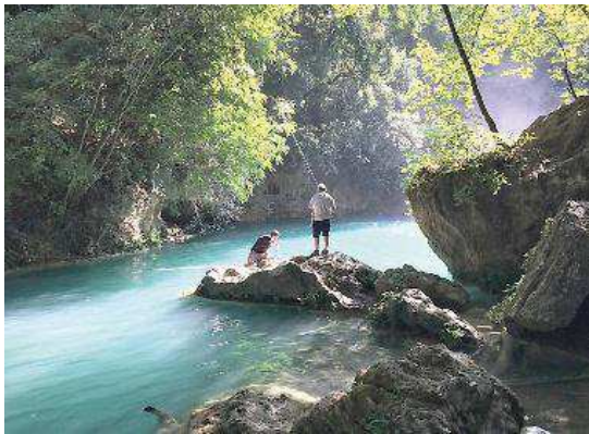
Una parte del Parco Fluviale dell'Elsa, molto frequentato dai turisti

E' solo la prima di due iniziative rivolte all'utilizzo dell'acqua dell'Elsa per la produzione di energia idroelettrica: sempre oggi, una seconda visita d'istruttoria si terrà nell'area della Fer-