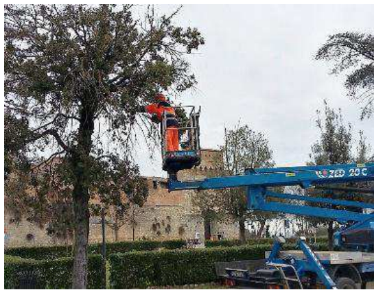
Gli operai del Comune in azione nelle aree verdi della città

Spesso questo storico polmone è stato un luogo troppo trascurato dove si trova il monumento in pietra serena e travertino dedicato ai Caduti di tutte le guerre con ai piedi il cimelio conquistato nella Prima Guerra