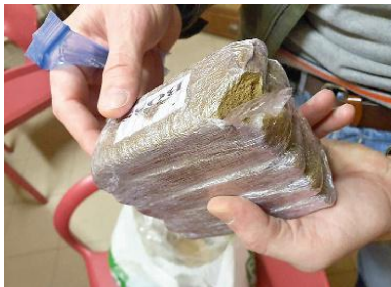
La droga recuperata dai carabinieri di Poggibonsi che hanno arrestato un 45enne

Spacciava in casa , nascondendo la droga sotto il cuscino della poltrona della nonna, del tutto ignara di starsene seduta su grammi e grammi di hashish. Il pusher in questione, a cui non fa certo difetto la fantasia, aveva addirittura griffato le confezioni di stupefacente attaccandovi un adesivo con una foglia di marijuana stilizzata: una sorta di marchio di fabbrica. Il tipo, un 45enne di Poggibonsi già noto alle forze dell'ordine, è stato arrestato dai carabinieri per detenzione di droga, 600 grammi in tutto, finalizzata allo spaccio. Era parecchio tempo, stando a quanto riferito dagli stessi inquirenti, che i militari della stazione di Poggibonsi tenevano d'occhio il 45enne. Da quando avevano avuto il sentore che spacciasse direttamente nella sua abitazione lo pedinavano e ne spiavano le mosse, soprattutto in borghese, per non insospettirlo. Appiattandosi per una giornata intera sulle scale del condominio, i carabinieri della stazione poggibonsese avevano notato che, stranamente, il 45enne