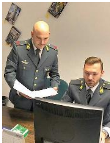
La Guardia di finanza è impegnata contro l'evasione fiscale

Il coronavirus non ferma la lotta all'evasione fiscale della guardia di finanza. I militari del comando di Siena hanno scoperto una società edile della Valdelsa che ha truccato le proprie carte contabili, per non dichiarare ricavi per oltre 200.000 euro in ordine a imposta diretta, Irap e Iva: per quest'ultima aveva presentato una dichiarazione che riportava un volume d'affari molto inferiore al reale, mentre per le prime due non l'aveva presentata affatto. La verifica dei finanziari si è concretizzata ricostruendo le operazioni imponibi-